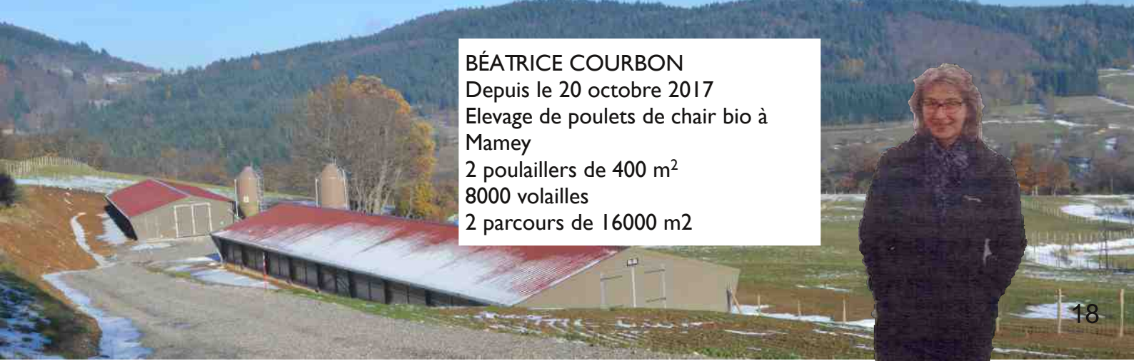
BÉATRICE COURBON Depuis le 20 octobre 2017 Elevage de poulets de chair bio à Mamey 2 poulaillers de 400 m 2 8000 volailles 2 parcours de 16000 m 2