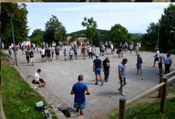
Vide grenier, fête d'été, pétanque.