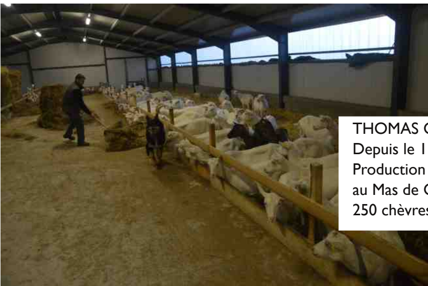
THOMAS CHAMBEFORT Depuis le 1 avril 2017 Production : lait de chèvres au Mas de Cheval 250 chèvres prévues