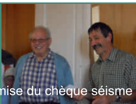
remise du chèque séisme

De nombreuses autres activités seront à découvrir au cours de l'année. Les