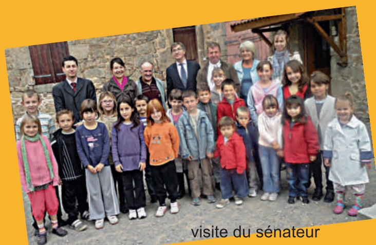
visite du sénateur