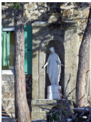
Vierge de la maison Oriol, XIXe siècle