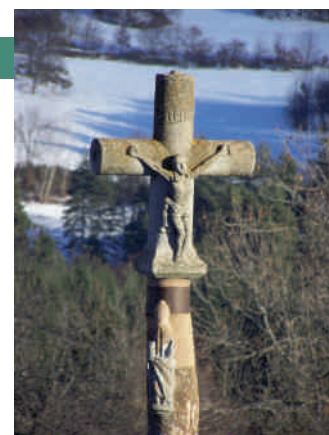
croix du cimetière

Piédestal en "corbeille". Croix dont la hampe a la forme d'une colonne cylindrique avec base et chapiteau, et au dessus, croix courte de même section. Sur le socle de la base de la colonne, inscriptions et date, très érodées. Sur la doucine de la corniche, relief d'un crâne. A mi-hauteur du fût, haut relief d'un personnage. Sur la croix, à l'envers, relief du Christ en croix et, au revers, relief de Marie-Madeleine. Datation : 1751