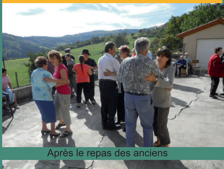
Après le repas des anciens

C'est un petit souvenir, A chacun il saura faire plaisir Une chanson entre nous, Certes ce n'est pas beaucoup, Mais à Colombier on est joyeux. Elle égayera nos coeurs, En faisant reflourir le bonheur, Et pour tous jeunes et vieux Ce sera grand' gaieté D'fredonner la chanson de Colombier.